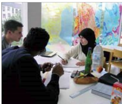
Darmstadt - Kranichstein